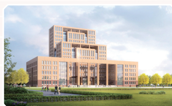
规划建设图书信息中心

学院按国家政策为经济困难学生办理生源地助学贷款（在校期间免息），贷款额度按国家有关政策执行。