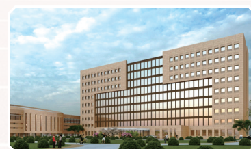
规划建设旅游服务专业实训楼