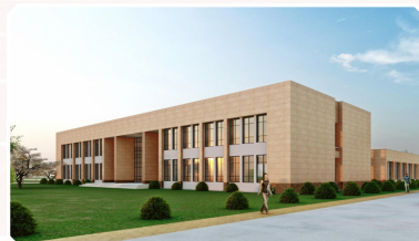
规划建设动物疾病诊疗中心